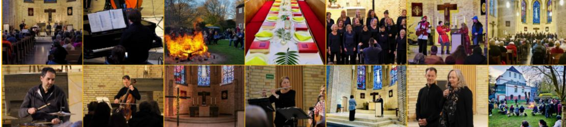
Impressionen aus der Gemeinde Frühling 2026