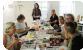
Ein Jahr Brush Crew