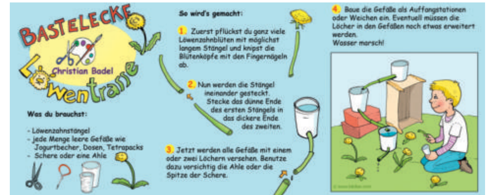
Grafiken: Bodel + Pfeffer

Foto: Gerd Eisentraut, Grafik: Martin Lubpl by Shutterstock