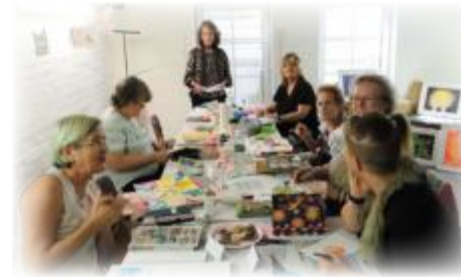
Das Team der Brush Crew Friedenskirche Eilbek

Seit einem Jahr kommen wir als „Brush Crew“ zusammen, um gemeinsam im Gemeindehaus kreativ zu sein: Wir malen mit Acryl- und Aquarellfarben, stempeln und gestalten Karten. Außerdem probieren wir immer wieder neue Ideen aus – zum Beispiel Journaling in selbstgemachten Heften (etwa aus Briefumschlägen oder A3-Papier), die wir mit vielen Deko-Elementen individuell gestalten.