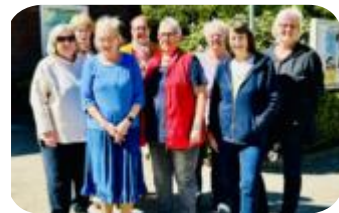
Neues aus dem Flohmarktcafé