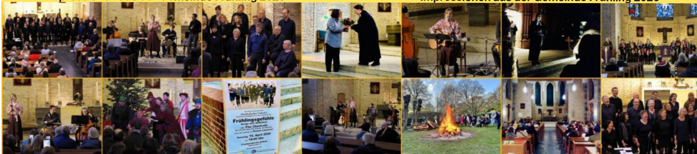
Konzerte aus der Reihe „Musikalisches Vielerlei“ in der Friedenskirche - Gospelgottesdienst - Einführung in den KGR - Agapemahl - Osterfeuer - Osternacht