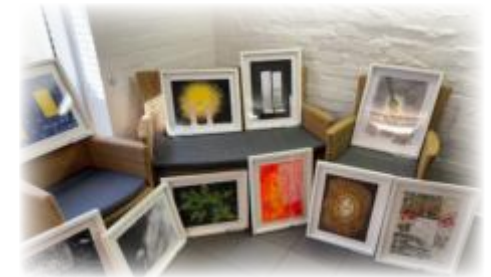
Bilder zum Motto der Nacht der Kirchen 2025 „Licht im Dunkel“

Treffpunkt: Gemeindehaus Papenstraße 70, 22089 Hamburg - Eilbek