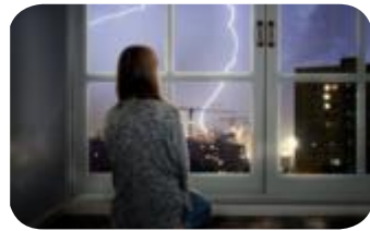
Thema „Aus heiterem Himmel“